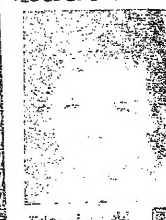
مواذ الياس حمري